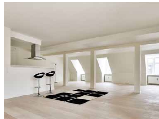
køkken / alrum