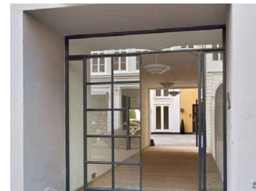
set fra gaden