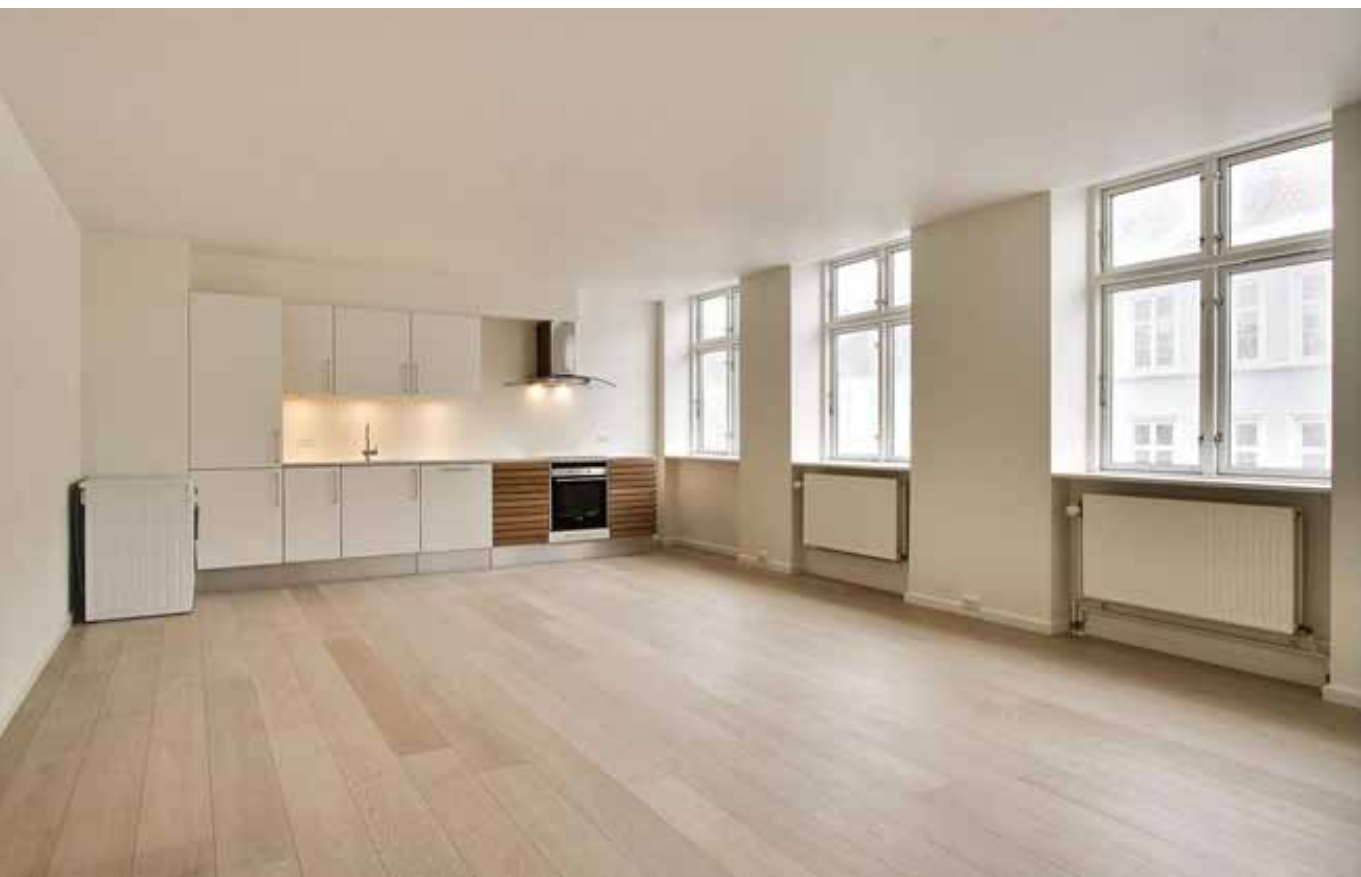
køkken / alrum

Lejlighederne i forhuset har glæde af lys fra gård og gadeside. Opholdsrum er placeret mod gaden, mens sove- og badeværelse er placeret mod gården. Gulvene i lejlighederne er lyse plankegulve i matlakeret eg.