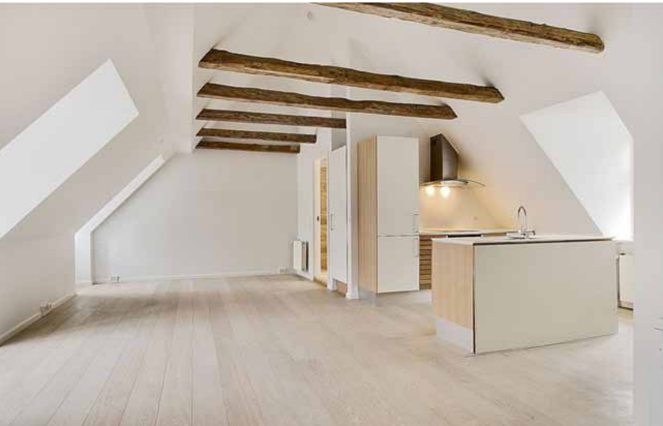
køkken / alrum