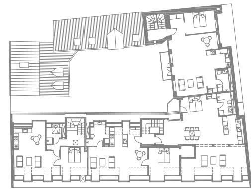
plan af tagetage